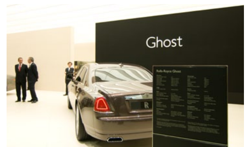
Rolls-Royce Motor Cars Messedesign und -kommunikation