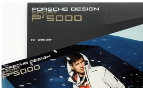
adidas Betreuung der Marke Porsche Design Sport