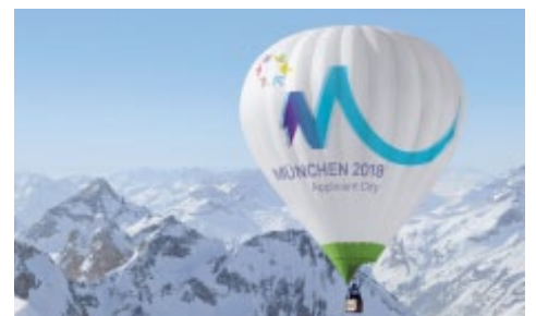
Olympiabewerbung München 2018 Logo, Corporate Design, Key Visual