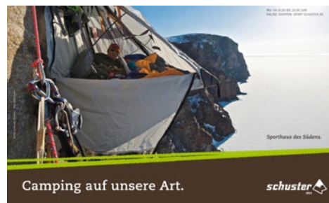
Sporthaus Schuster Lead-Agentur seit 2006